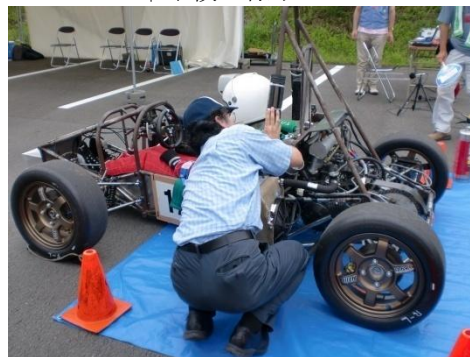
↑ガソリン漏れチェック