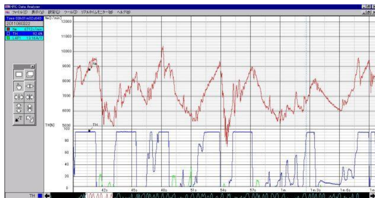
図1、データロガー画面

各走行時のデータロガーのデータを解析し、適切な燃調セッティングが得られるよう、調整を随時行っています。