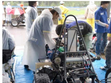
↑ ドライバースタンバイ