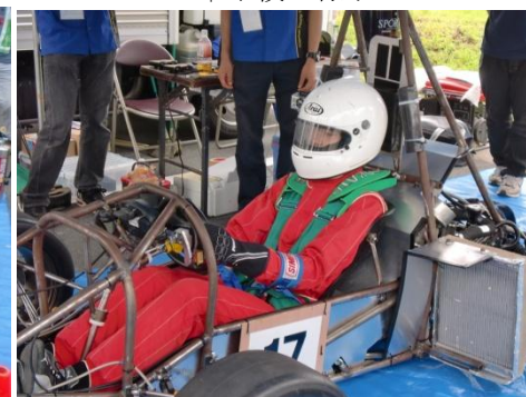
↑ドライバー緊急脱出試験