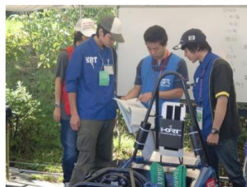
↑コストレポートと実際の車両の整合性チェック↑