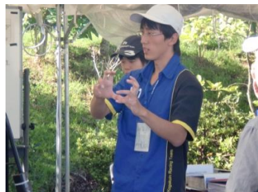
↑リアルケース(アセンブリ)↑