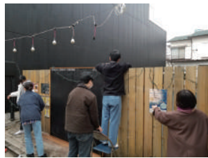
電飾準備中の黒板