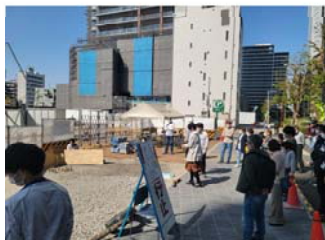
権利者の方を対象にモルック