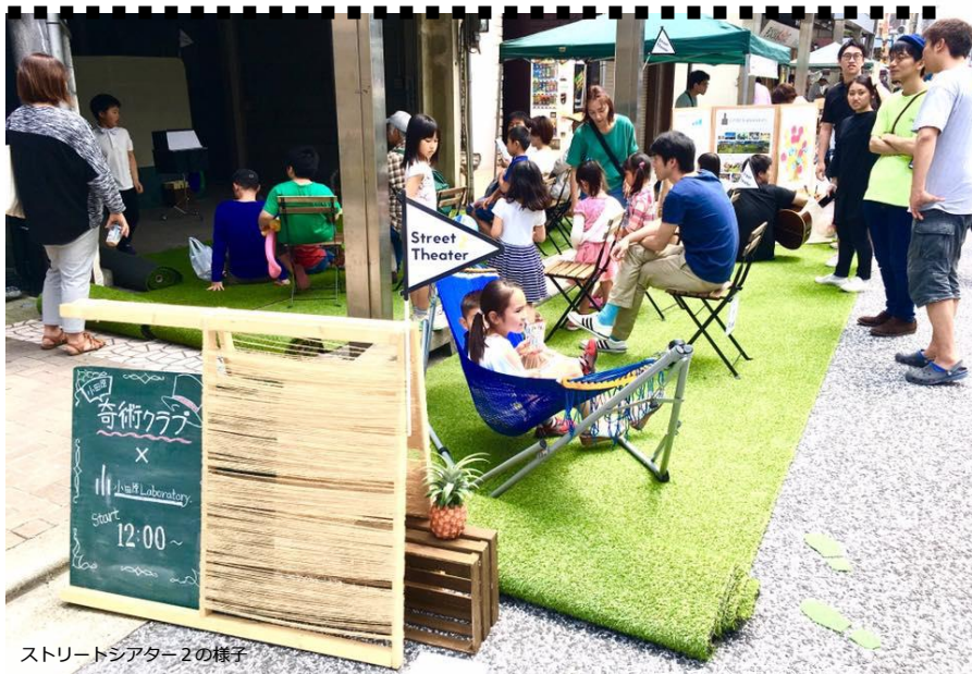
ストリートシアター2の様子